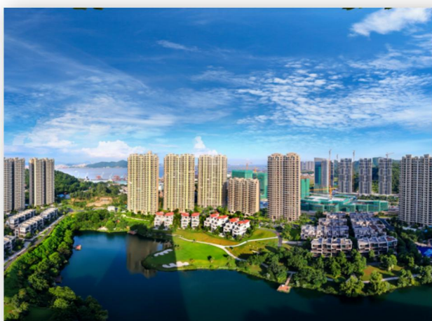
3、碧桂园南沙天玺湾项目